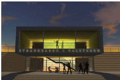
Sala taneczno-widowiskowa w Falsterbo, Szwecja