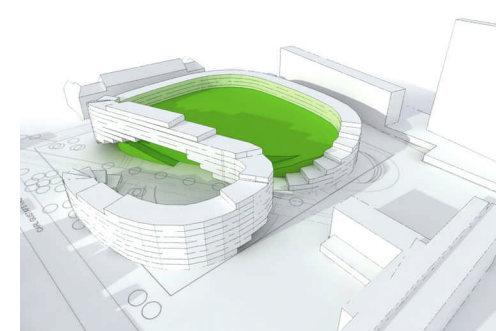
Kompleks sportowy „Miasto Kobiet” w Malmö