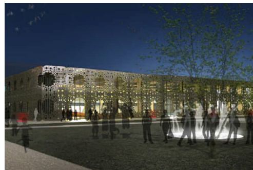
Basen miejski w Angelholm, Szwecja