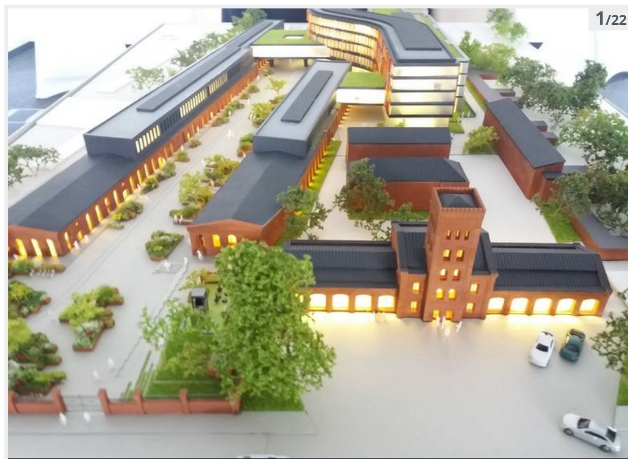
Textorial Park II. Widok na makiecie od strony ul. Tymienieckiego. Opis: Przejdź do galerii

Jeszcze w tym roku rozpocznie się drugi etap rewitalizacji pofabrycznego królestwa strażackiej.